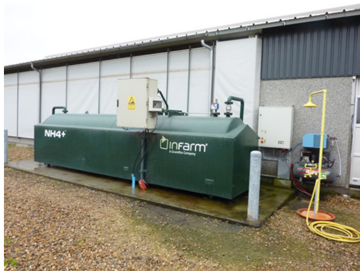
Gylleforsøringsanlæg fra Infarm der kan regulere pH i gødningen

Svovlsyrebehandling af kvæggylle er en teknologi, der har gjort sit indtog hos danske mælkeproducenter. Investeringen begrundes i såvel dyrevelfærd som miljøkrav. Den samlede ammoniakfordampning fra såvel stald som lager reduceres med 50 % ved tilsætning af svovlsyre ( FarmTest, kvæg nr. 21 – 2004 ) i forhold til spaltegulv med ringkanal eller bagskyl.